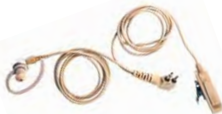
HMN9754 Conjunto do fone de ouvido com microfone e PTT combinados