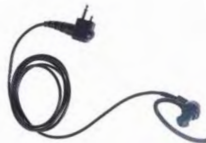
RLN4894 Fone de ouvido somente para recepção preto