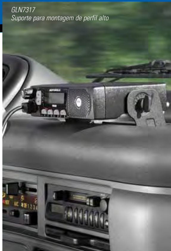
GLN7317 Suporte para montagem de perfil alto