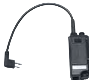
BDN6646 Sistema de microfone de ouvido com interface PTT