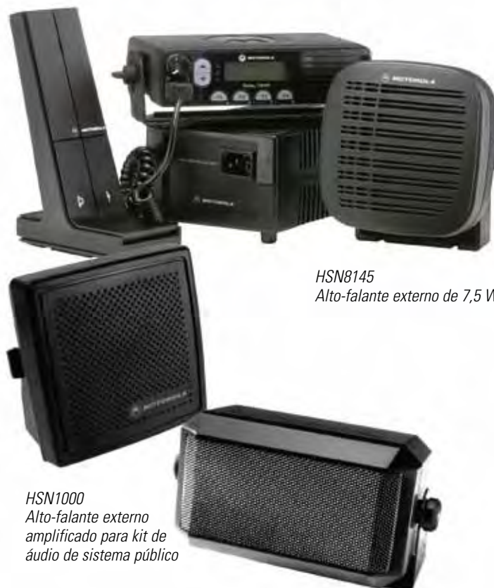
HSN8145 Alto-falante externo de 7,5 Watts