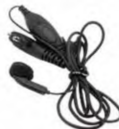
HMN9036 Fone de ouvido com microfone e PTT