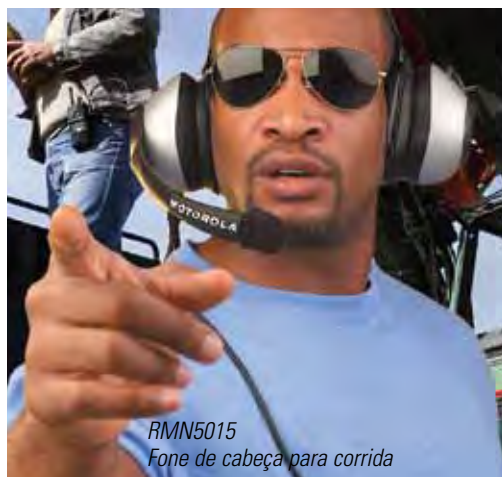
RMN5015 Fone de cabeça para corrida