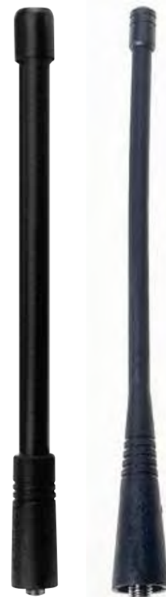
NAD6502R Antena Heliflex VHF NAE6483R Antena flexível tipo látigo de 15 cm (6 polegadas)