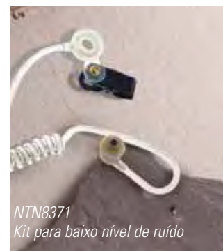
NTN8371 Kit para baixo nível de ruído