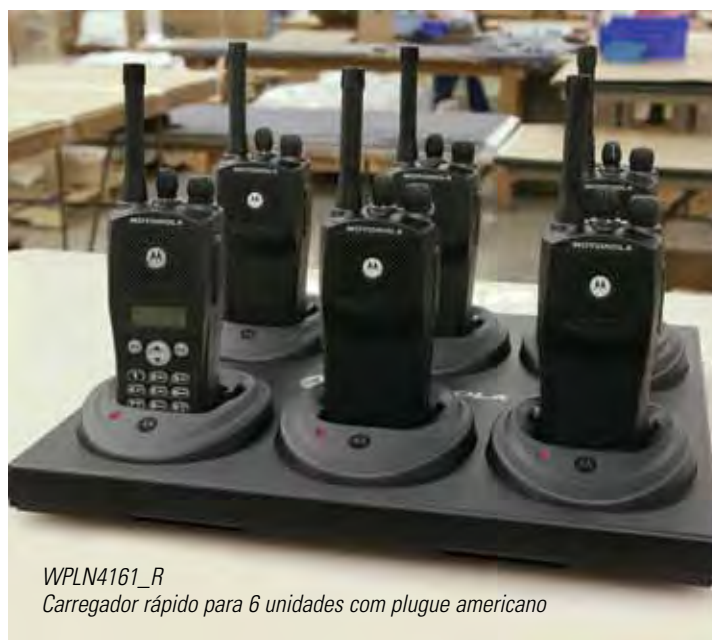
WPLN4161_R Carregador rápido para 6 unidades com plugue americano