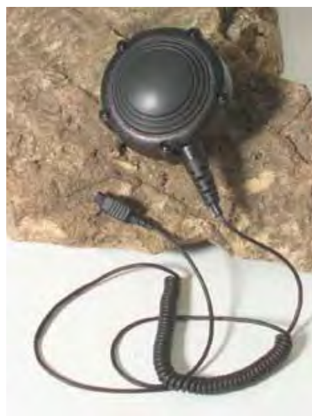
0180300E83 Interruptor PTT para corpo