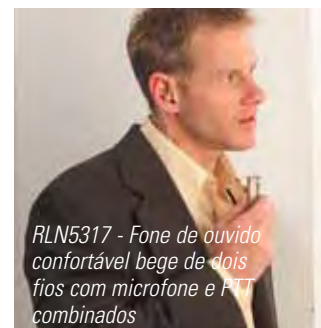
RLN5317 - Fone de ouvido confortável bege de dois fios com microfone e PTT combinados