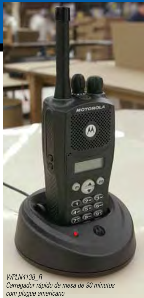
WPLN4138_R Carregador rápido de mesa de 90 minutos com plugue americano

Os carregadores múltiplos oferecem seis bases de carregamento para carga rápida e simultânea de uma a seis baterias de NiMH, NiCd e Li-ion. As baterias podem ser carregadas com ou sem o rádio.