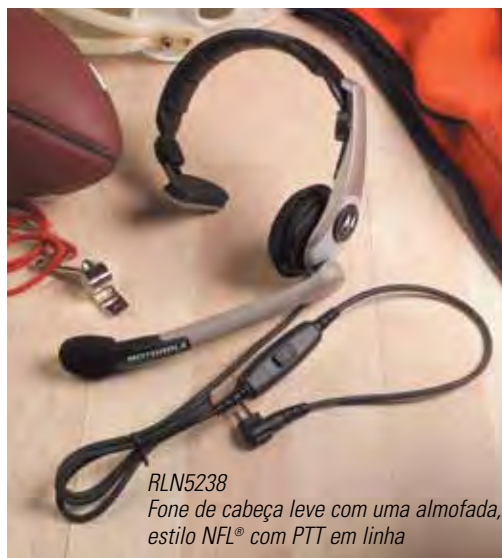
RLN5238 Fone de cabeça leve com uma almofada, estilo NFL® com PTT em linha