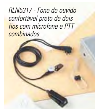
RLN5317 - Fone de ouvido confortável preto de dois fios com microfone e PTT combinados