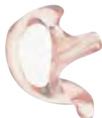
RLN4763 Fone de ouvido confortável, transparente, personalizado

Feito com material hipoalergênico, não irritante e fácil de limpar, esses fones são projetados para adaptar-se à parte interna da orelha. É perfeito para ambientes com baixo nível de ruído. Requer o conjunto de tubo acústico transparente NTN8371 e um kit de vigilância Motorola para operação.