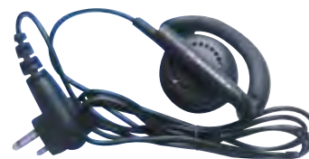
BDN6720 - Receptor de ouvido flexível preto