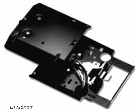
HLN8097 Montagem deslizante removível