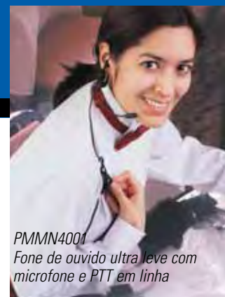
PMMN4001 Fone de ouvido ultra leve com microfone e PTT em linha