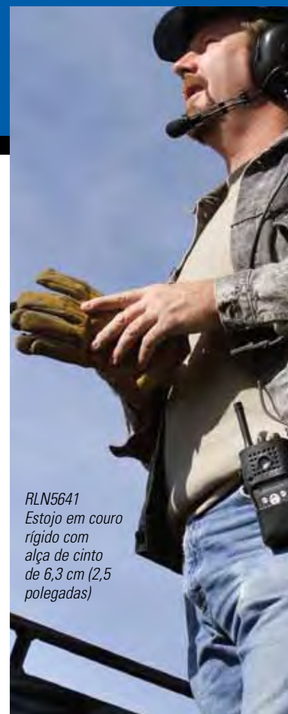
RLN5641 Estojo em couro rígido com alça de cinto de 6,3 cm (2,5 polegadas)