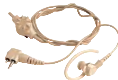
HMN9752 - Fone de ouvido somente para recepção bege com controle de volume