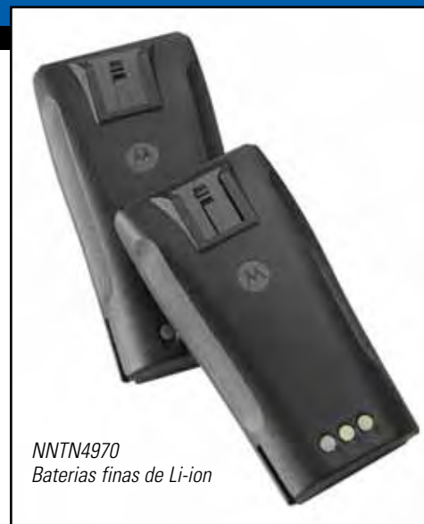
NNTN4970 Baterias finas de Li-ion