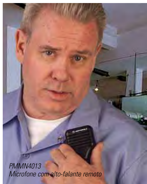
PMMN4013 Microfone com alto-falante remoto