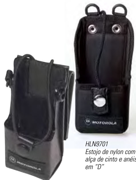
HLN9701 Estojo de nylon com alça de cinto e anéis em "D"