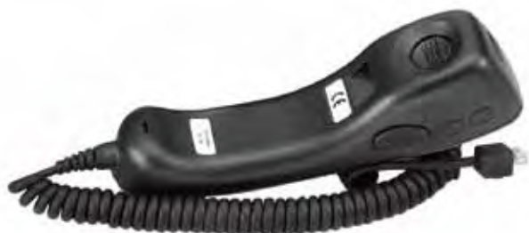
AAREX4617 Fone estilo telefone

O fone em estilo telefone é ideal para os usuários que querem conduzir conversas privadas